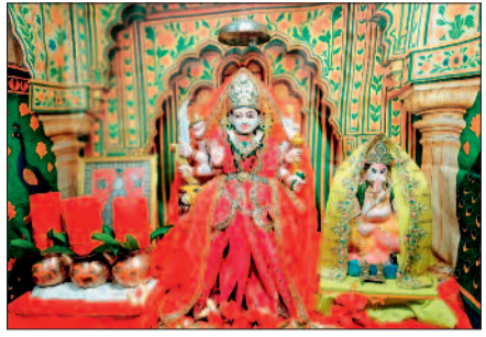
हरिभूमि न्यूज ▶▶ राजिम