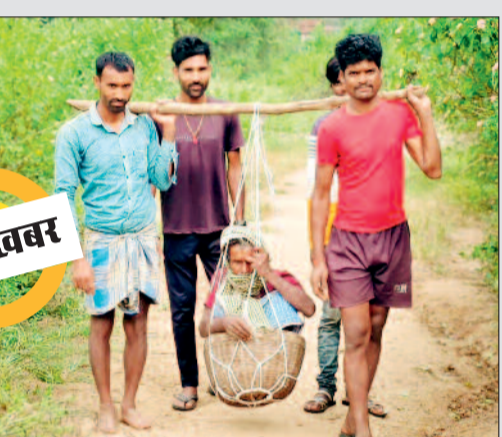
घोषणा के 8 साल बीते, सर्वे हुआ पर काम नहीं

गरियाबंद जिले के आदिवासी विकासखण्ड मैनपुर क्षेत्र में पहाड़ी इलाके की बात तो छोड़ दीजिए तहसील मुख्यालय के नजदीक के गांवों में भी आज आजादी के 78 सालों बाद भी पक्की सड़क का निर्माण नहीं किया जा सका है और तो और अत्यधिक बीमार के साथ ही गर्भवती महिलाओं को कांवर और खाट में लिटाकर मैनपुर अस्पताल तक लाना पड़ता है। इस गांव के पंचायत बोर्डिंगगांव मे तत्कालीन मुख्यमंत्री एवं वर्तमान विधानसभा अध्यक्ष डॉ. रमन सिंह जब पहुंचे थे तो उन्होंने ग्रामीणों की मांग पर पक्की सड़क एवं डुमरघाट में बिजली लगाने का घोषणा किया था। पूर्व मुख्यमंत्री के द्वारा घोषणा करने के बाद बकायदा अफसरों की टीम गांव तक सड़क बनाने के लिए प्रधानमंत्री ग्राम सड़क योजना के अफसरों ने कई दिनों तक सर्वे किया और एक माह के अंदर सड़क निर्माण कार्य शेष पेज 10 पर